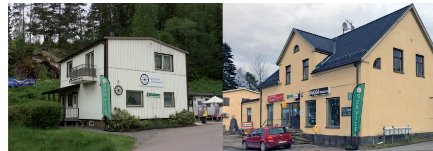
Servicepunkten i Skillingsfors